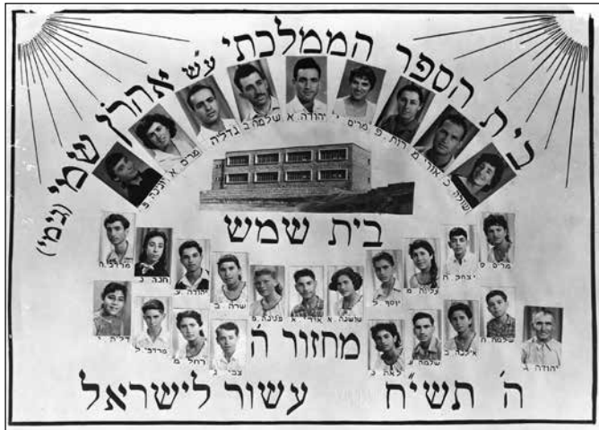
איור 2: תמונת מחזור תשי"ח הנושאת את השם החדש של בית הספר