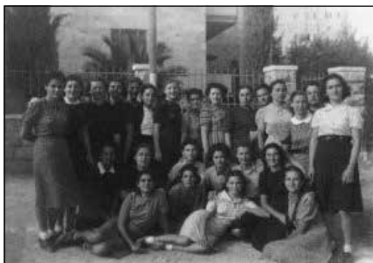
איור 10: תלמידות בפנימייה ליד בניין הסמינר ברחוב אלחריזי, שכונת רחביה, ת"ש (1939/40)

לכיתת הלימוד. מתוך דאגה לתלמידות הצעירות שהגיעו לירושלים מהיישוב הישן בצפת ובטבריה, מהיישוב החדש בתל אביב ובחיפה ומהמושבות, היא הקימה פנימייה: "ולא הצד הכלכלי עיקר, אלא החנוך עיקר", כתבה בשנת 1938, "בנות חוץ מוצאות סביבה דתית בהדרכת בית מתאימה, בשלחן של שבת, בתפילה ובזמירות וב[השגחה] נעימה ומעולה". 101 כדי לממן את המיזם היא והשקיעה מאמצים רבים בגיוס תורמים בארץ ובחוץ לארץ, ואף נסעה בעצמה לגייס כספים באנגליה, בסקוטלנד ובאירלנד. 102