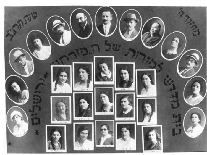
איור 3: מחזור ה', תרצ"ב (1932)

תרצ"ג היה שפל. 61 גיל התלמידות היה בין 15 ל-18, אם כי אחדות היו צעירות או מבוגרות יותר. 62 כשני שלישים מהתלמידות היו בנות ירושלים והאחרות הגיעו מחוץ לעיר ואף היו עולות חדשות; כ-90% מהן היו אשכנזיות. 63 למחזור הראשון הגיעו תלמידות שלמדו קודם לכן בתלמודי תורה לבנות של המזרחי: ת"ת לבנות א' ובית הספר 'למל'; תלמידה אחת הגיעה ממטולה. למחזור השני התקבלו גם תלמידות מפתח תקווה ומסג'רה, ובשנת תרפ"ו למדו שלוש תלמידות מצפת. 64 התלמידות שלא היו ירושלמיות התגוררו אצל קרובי משפחה בעיר או מצאו מגורים אצל משפחות אחרות.