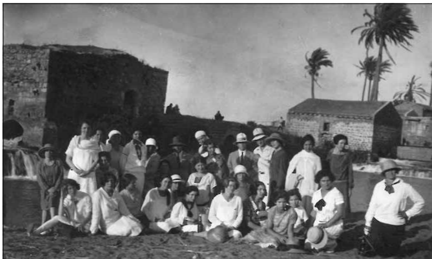
איור 9: טיול לירקון, תרפ"ט (1929)

ד"ר זיידל לא קידם תכניות ייחודיות לנשים, אך בימיו לימדו בבית המדרש מורים ומורות שעיצבו את דמות המוסד והעניקו לו את אופיו הייחודי. דמויות המופת של המורים בסמינר, ובמיוחד של המורות, הקרינו על דרכן של התלמידות לאורך שנים. אף כי סגל ההוראה התנגד לרעיונות פמיניסטיים, החינוך שהעניקו במוסד הביא להעצמה אישית של הבוגרות כנשים, להשתתפותן הפעילה בעיצוב החינוך בארץ ולמעורבותן הפעילה במרחב הציבורי.