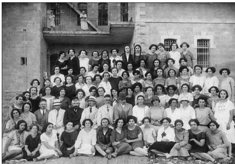
איור 4: תלמידות ומורים בחצר הסמינר ברחוב סט' פאול 82 (היום רחוב שבטי ישראל), תר"ץ (1930)

ראשיתה של הכשרת מורות בחינוך הדתי-לאומי בארץ ישראל