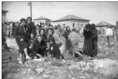
איור 8: תלמידות משתתפות בהתכנסות ט"ו בשבט של בתי הספר בירושלים מטעם קק"ל