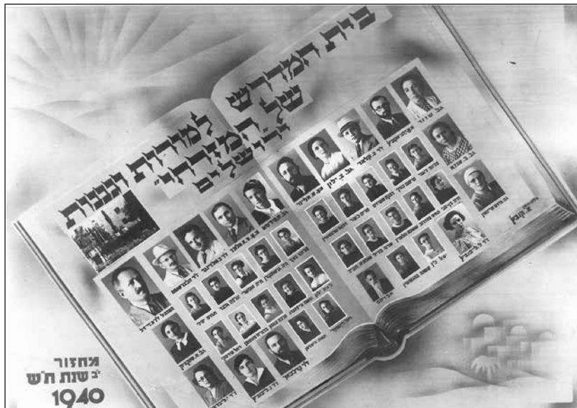
איור 5: מחזור י"ב, ת"ש (1940)