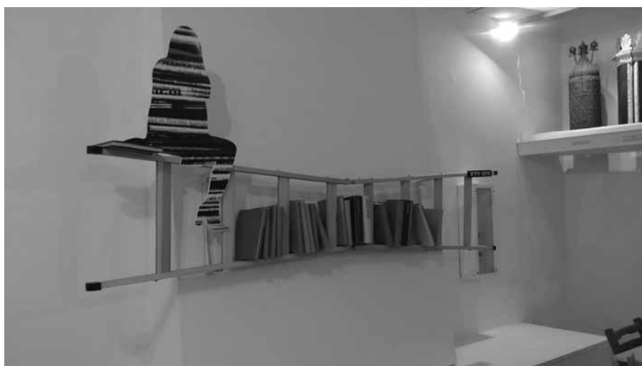
תמונה 5: סולם ערכים, תערוכת 'מוזה'־סו!, היכל שלמה, ירושלים 2015