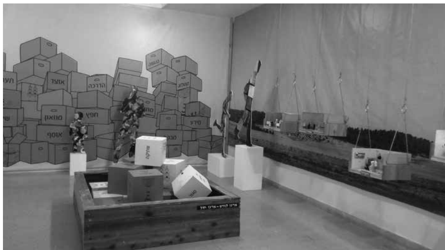
תמונה 1: המרחב האינטראקטיבי, תערוכת 'מוזה'־סו!, היכל שלמה, ירושלים 2015