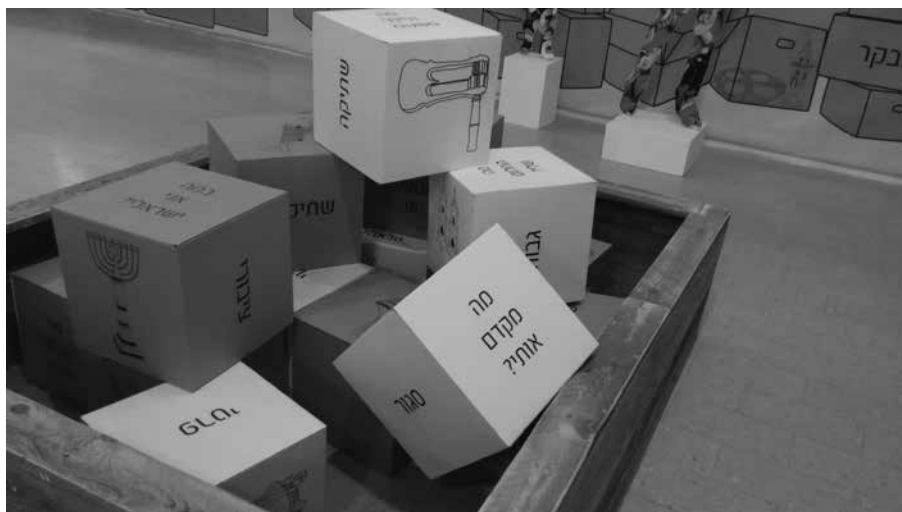
תמונה 4: קיר טיפוס, תערוכת 'מוזה'־סו!, היכל שלמה, ירושלים 2015