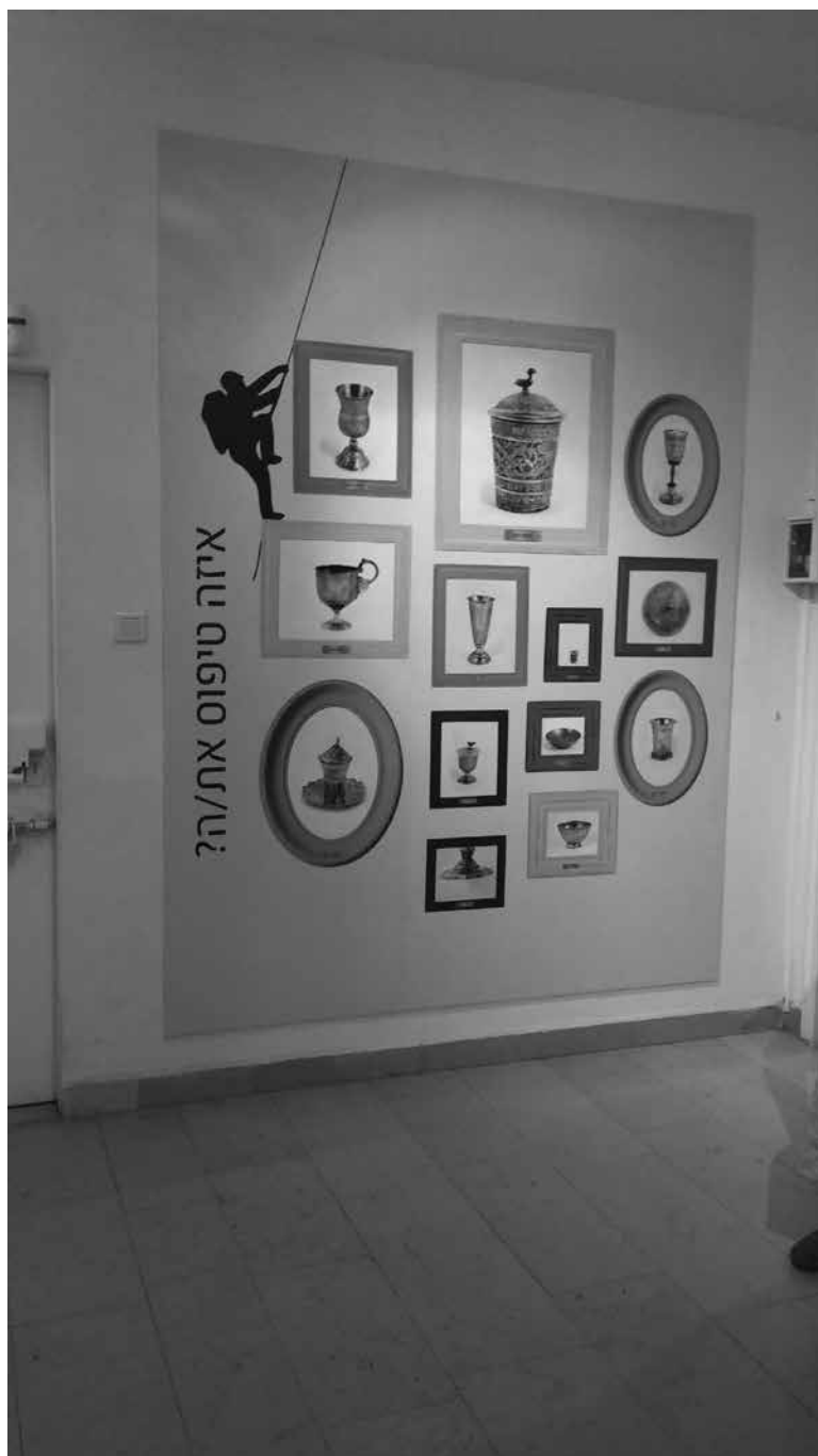
תמונה 3: משחק קוביות אינטראקטיבי, תערוכת 'מוזה'סו!', היכל שלמה, ירושלים 2015