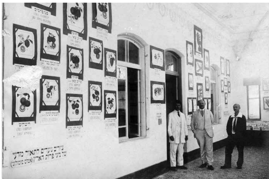
ציורים נועדים לתיאור מדעי של מיני פירות הארץ (אטלס פומולוגי), צילום של עקיבא אטינגר, ברוך ציז'יק והצייר אהרן הלוי, פתיחת התערוכה בתל אביב, 1919