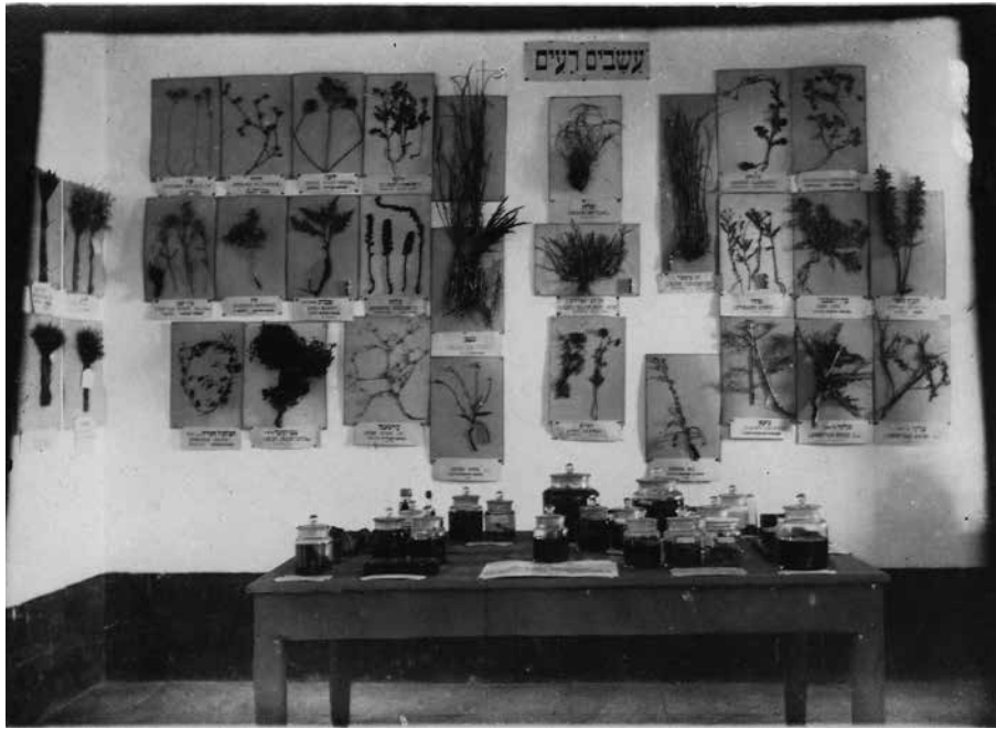
צמחים רעים, המוזאון החקלאי, בית מחניים ירושלים 1919

מחלקת מחלות ומזיקים של צמחים; מחלקת התעשייה החקלאית; מחלקת צילומים ותמונות מההתיישבות החקלאית בארצנו; מחלקת העשבייה; מחלקת הספרייה המקצועית. 40 התצוגה עוטרה בציורי פרות, פרחים וכדומה, שציורו בצבעיהם הטבעיים בידי הצייר אהרן הלוי. 41