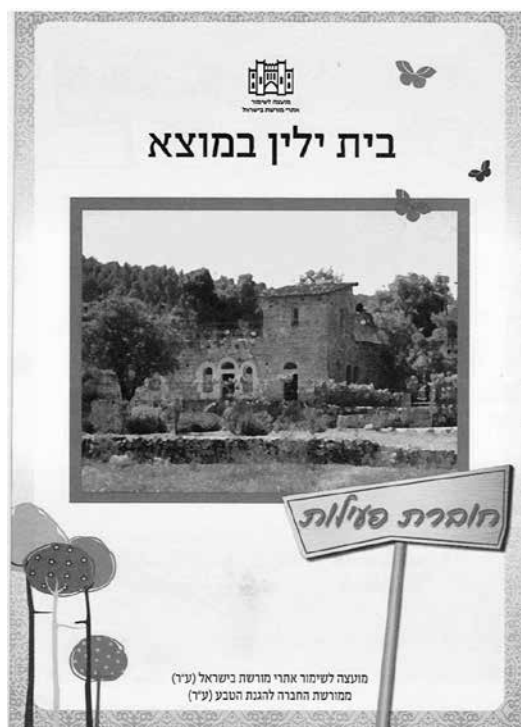
תמונה 10: חברת פעילות לנוער במוזאון בית ילין