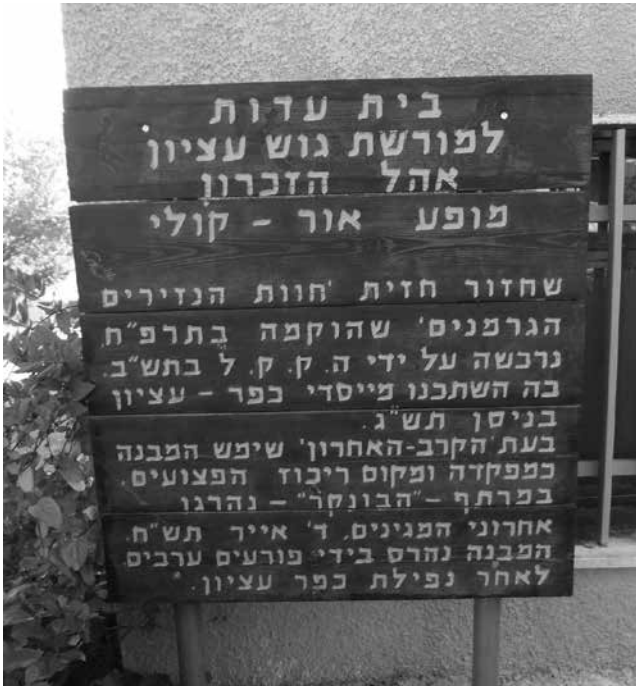
תמונה 7: שלט הכניסה לבית העדות בכפר עציון

ושם מוקרן חיזיון אור קולי, מעל הבור שנהרגו בו אחרוני מגני כפר עציון (תמונה 7). בית העדות משמש גם מקום שנשמר בו 'אות הקוממיות' שקיבל הקיבוץ כהוקרה על מאבקו במלחמת העצמאות.