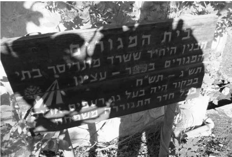
תמונה 6: שלט הנצחה לבית היחיד ששרד בכפר עציון לאחר מלחמת תש"ח

מבנה הנצחה המרכזי הוא המוזאון המציג את קורות המאבק על גוש עציון; החל בניסיונות ההתיישבות ובשלבי המערכה, המובאים בסדר כרונולוגי עד לפיולה. המוזאון חודש בשנים האחרונות והוכנסו בו אמצעים אורקוליים וסרטים הממחישים למסייר במקום כיום את הוויי החיים בעבר. יש גם כמה מוצגים (סמלים מספר אותות) מהימים ההם. בסמוך למוזאון הוקם בית עדות, הממוקם במנזר הגרמני,