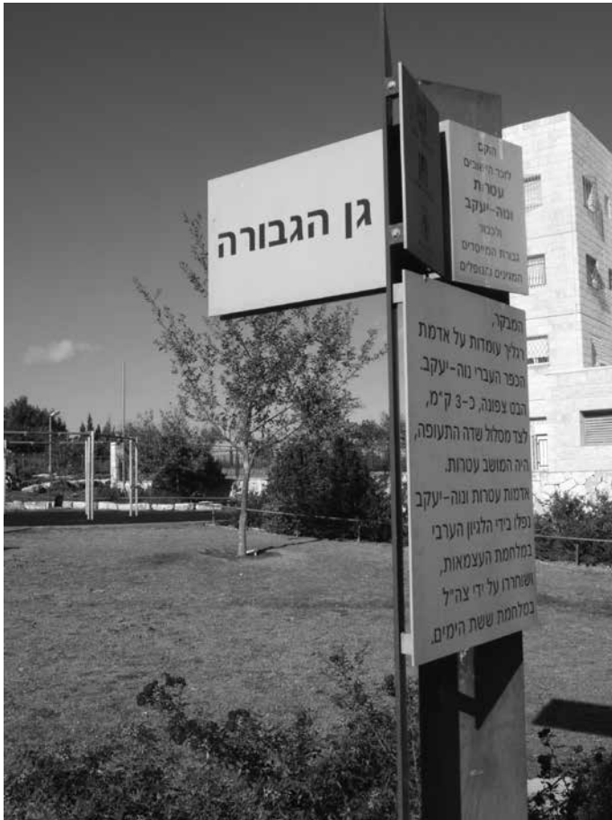
תמונה 2: גן הגבורה, מוזאון הנצחה בשטח הפתוח להתיישבות מצפון לירושלים

במושב בני עטרות, הנמצא בשפלה, שאליו עברו כ־35 משפחות מתוך ה־47 שהתגוררו בעטרות, יש גן זיכרון קטן שחוקקים בו שמות הנופלים בעטרות 7 (תמונה 3). נוסף עליו יש במושב מוזאון קטן – למעשה חדר הנצחה – ובו לוח הנצחה לכל אחד מהנופלים, שבו מידע על כל נופל וזרכו במושב. משלטי ההסבר אפשר לקבל מידע על הווי