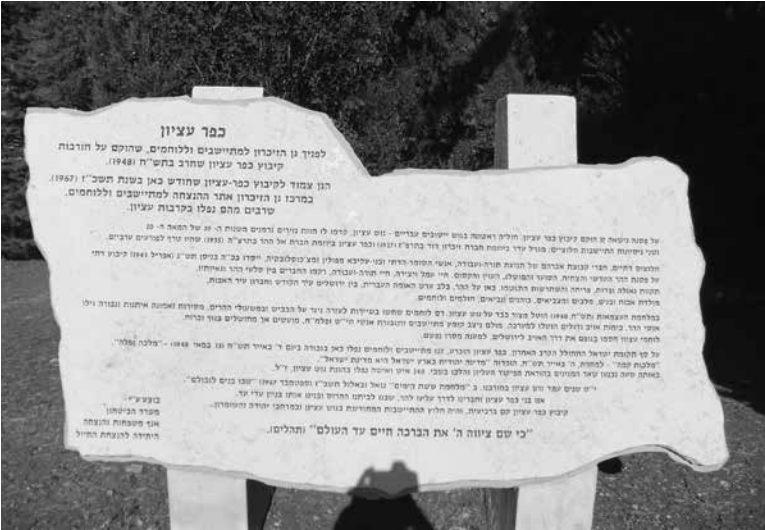
תמונה 5: שלט הנצחה להתיישבות במוזאון הפתוח בכפר עציון