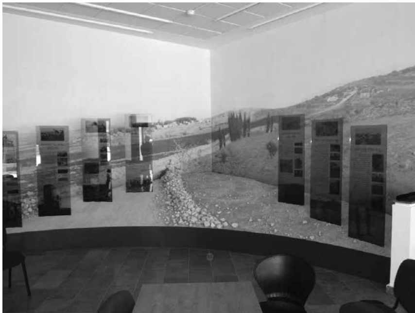
תמונה 1: מוזאון ההנצחה להתיישבות מצפון לירושלים בגבעת התחמושת

שהיה בשדה התעופה, מציגה את תולדות המקום בשישה שלטים, וכל שלט מפרט פרק היסטורי של היישוב. בסמוך תלויה רשימת הנופלים לאורך שנות היישוב עד תש"ח. המבקרים יכולים לחזור בסרט קצר המספר על תולדות היישובים ועל סופם במלחמת העצמאות (תמונה 1).