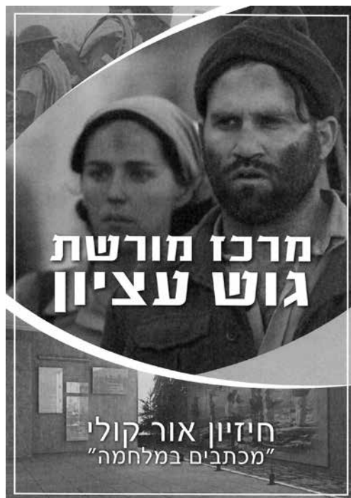
תמונה 7א: דפדפת הסבר לחיזיון האור-קולי בכפר עציון

במסגרת אתרי הנצחה המוזאליית בכפר עציון צריך לציין גם את 'אתר העץ' בסמוך למשרדי המועצה המקומית גוש עציון, שבהם סיפור ארבעת הקיבוצים - לכל אחד מהם יוחד שלט הסבר סביב האלון הבודד. 14