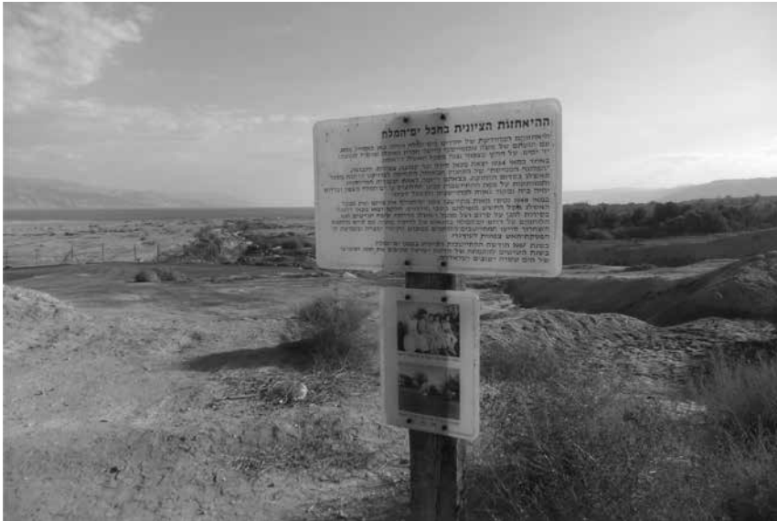
תמונה 4א: שלט הנצחה למפעל האשלג ועובדיו המצוי בשטח הפתוח

3. כפר עציין – בכפר עציין יש הנצחה משמעותית ביותר לכל קורות הגוש לאורך הדורות, בהדגשת חמש השנים שלפני תש"ח. 12 ההנצחה נעשית בשלטים במרחב הפתוח (תמונה 5), המציינים את תולדות הקיבוץ וההתיישבות בגוש ובשלטי הסבר לאתרים במשק שהם שרידי הקיבוץ בעבר (בור מים, בית המגורים היחיד ששרד, המנזר הגרמני) (תמונה 6).