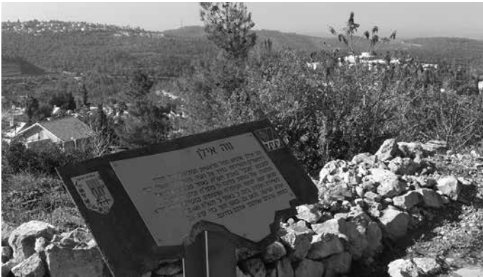
תמונה 13: נווה אילן, קיבוץ משלט: אתר הנצחה

7. נווה אילן – לנווה אילן, או בשמו האחר 'קיבוץ משלט', יש היסטוריה קצרה של כשנתיים, מאוקטובר 1946 עד ימי תש"ח; נקודה קטנה על גבעה הסמוכה לכניסה ליישוב נווה אילן של היום. במקום שרידי מבנים יחידים וכמה עמדות, ושילוט הסבר על המקום. בית האבן שהיה במקום ('חירבת' אל הוואי) ושופץ היה בית אפנדי תורכי מהמאה ה-19, ושימש חדר אוכל, מטבח ומרפאה למתיישבים הראשונים 21 (תמונה 13).