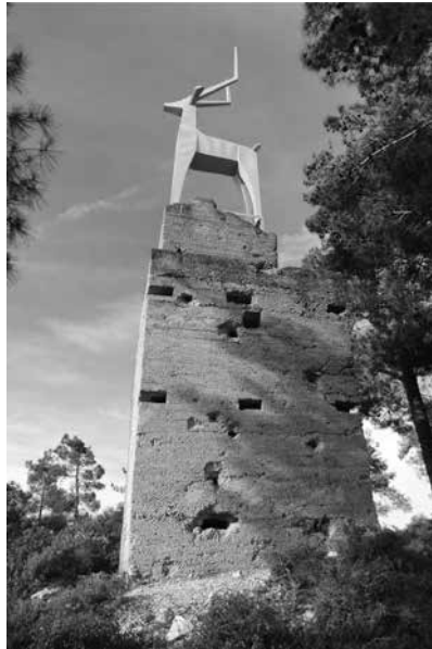
תמונה 11: עמדת הצבי, אתר הנצחה בנוף הפתוח למורשת קריית ענבים

6. קריית ענבים ומעלה החמישה – בשני הקיבוצים אין מוזאון או חדר המנציח את ההתיישבות במקום ואת תולדותיו. 17 יש מעין הנצחה בשטח הפתוח בעמדת בית פפרמן, וכן בעמדות הפונות לעבר גבעת הרדאר ובמוצב הסנטוריום, שהיו חלק ממערך ההגנה במקום בזמן מלחמת העצמאות ועד למלחמת ששת הימים 18 (תמונה 11). בזמן האחרון (תשע"ה) שילטה המועצה לשימור אתרים מקצת המבנים ההיסטוריים בקיבוץ קריית ענבים [רפת, בית תינוקות, חדר האוכל, בית הנוער הגרמני, גן צילה (הבת הבכורה של הקיבוץ), שני בתי מגורים ראשונים ועוד]. 19 לשני הקיבוצים יש ארכיונים הפתוחים לקהל הרחב. בכניסה לארכיון קריית ענבים יש תצוגת תמונות המציגה את תולדות הקיבוץ ואת מגוון ענפיו: הנטיעות הראשונות, הלול, הרפת 20 והבתים הראשונים (תמונה 12). ליד מבנים היסטוריים מוצב שלט של המועצה לשימור אתרים המציינת את חשיבות המבנים, כמו הרפת הראשונה.