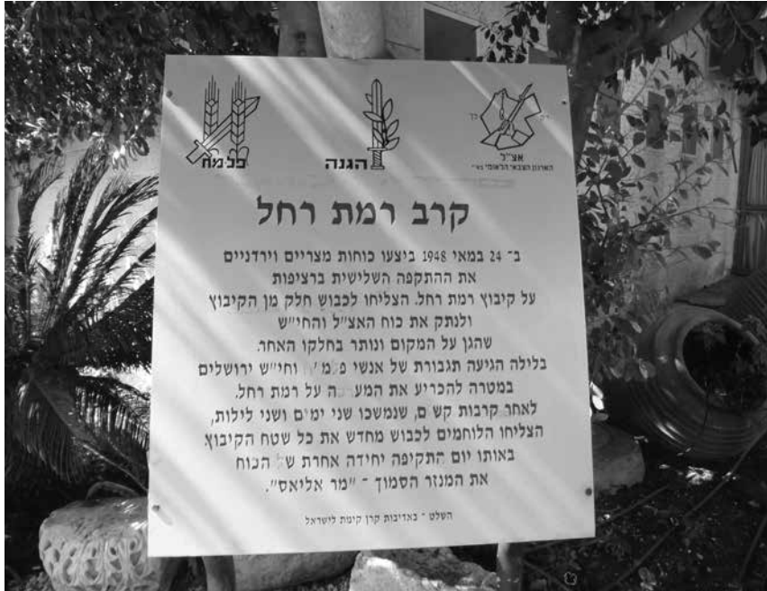
תמונה 8: רמת רחל – הנצחה בכניסה למלון בקיבוץ

5. בית ילין (מוצא) – אתר בית יהושע ושרח ילין שוקם, שומר ונפתח במהלך שנת תשס"ט (2009) תחת הנהלת המועצה לשימור אתרי התיישבות 15 (תמונה 9). מטרת בית ילין להדגים את סיפורה המרתק של המושבה מוצא בראשיתה, את סיפורי מתיישביה הראשונים ואת דמויות בני משפחת ילין לדורותיהם. 16 למפעילי האתר המשוקם יש חזון ורציונל שעל פיו המקום מתפתח (ראו נספח ב). צוות ההדרכה במקום פיתח חומרי עזר למבקרים המותאמים למגוון גילים (תמונה 10). יש באתר חדר הרצאות קטן עם כמה שלטים שכתובות בהם תולדות המקום, וכן סרט קצר המדגים הדגמה סיפורית את שעבר המקום לאורך השנים. יש באתר פעילות חינוכית הקשורה להתיישבות ולמתיישבים במוצא בראשית דרכה, פעילות שנעשית סביב המבנים העוברים שיפוצים בשנים האחרונות. הפעילות בבית ילין היא חלק מפעילות בפארק סובב ירושלים שהאתר משתלב בו לאורך נחל שורק.