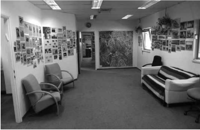
תמונה 12: תמונה מראשית הדרך בכניסה לארכיון בקיבוץ קריית ענבים

7. נווה אילן – לנווה אילן, או בשמו האחר 'קיבוץ משלט', יש היסטוריה קצרה של כשנתיים, מאוקטובר 1946 עד ימי תש"ח; נקודה קטנה על גבעה הסמוכה לכניסה ליישוב נווה אילן של היום. במקום שרידי מבנים יחידים וכמה עמדות, ושילוט הסבר על המקום. בית האבן שהיה במקום ('חירבת' אל הוואי) ושופץ היה בית אפנדי תורכי מהמאה ה-19, ושימש חדר אוכל, מטבח ומרפאה למתיישבים הראשונים 21 (תמונה 13).