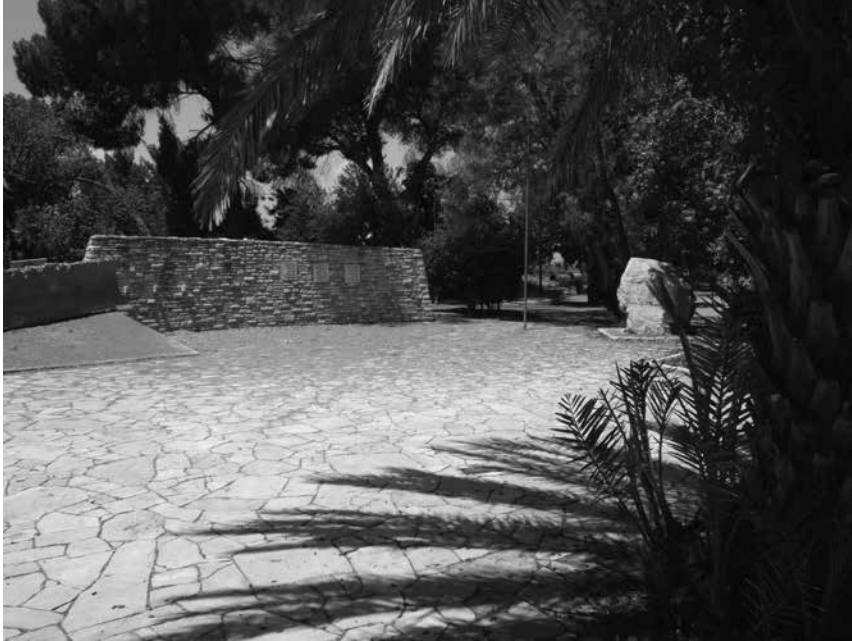
תמונה 3: גן זיכרון במושב בני עטרות

החיים בעטרות. 8 בחדר ההנצחה מופקד הטס, שהיה חלק מ'אות הקוממיות' שקיבל המושב כהוקרה על עמידתו במאבק במלחמת העצמאות. 9