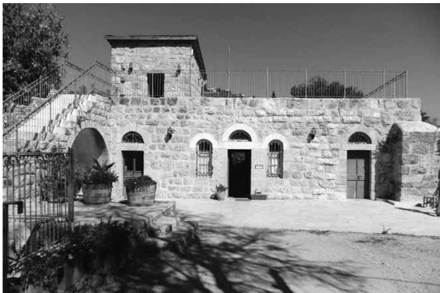
תמונה 9: המוזאון של בית ילין במוצא