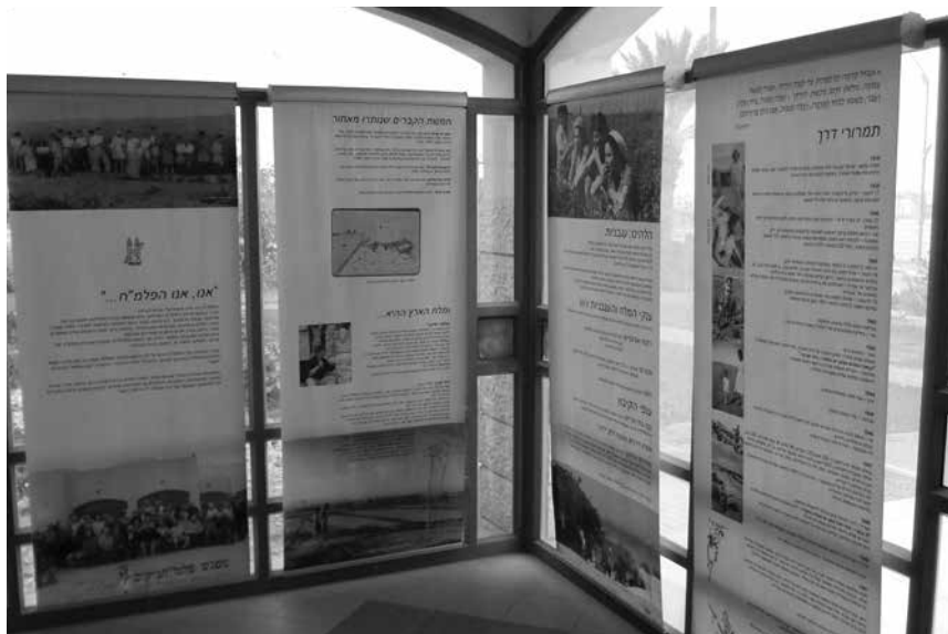
תמונה 4: הנצחה בקיבוץ בית הערבה כיום

של היום יש שלטים עם תמונות המנציחים את עבר הקיבוץ, ומידע מינימלי על קורות המקום לאורך השנים בציון הקשיים שהיו בשנים הראשונות להקמתו, עד שהפך לגן פורח במדבר (תמונה 4). בשלט אחד כתוב על העגבניות המשובחות שגידלו במקום ונדעו לשבח בשוקי ירושלים, שכה ציפו להן. בשלט אחר כתוב על חמשת הנופלים במקום, שקבריהם הם השריד היחיד לקיבוץ שהיה ואינו.