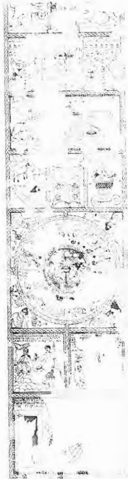
פסיפס בית הכנסת בציפורי סל הביכורים משובץ ברצועה הרביעית מלמעלה

להתייחס אליו באופן מילולי, ובוודאי שיש כאן רעיון שהאומנים, או מזמיני הפסיפס, להביע תוך יצירת הקשר בין תקווה לבניית המקדש ולקשר של החקלאי עם שדהו. אנו רואים כי פרט קטן מתוך פסיפס גדול מציין ומשלים תמונה ראלית של יישוב חקלאי המוכר מן המקורות והמדרשים, המדגישים לדעתנו שורשיות עמוקה וקשר של האדם לאזור מגוריו מחד-גיסא ולבורא שנתן את כל הטוב מאידך-גיסא. נוסף לכך עולים כאן צילי זיכרון למנהגים שנהגו בארץ ישראל ובמקדש. כמו המרכיבים האחרים בפסיפס שבציפורי, גם סל הביכורים בא למלא חלל אידאולוגי דתי המשקף מציאות חקלאית ראלית וכמיהה למנהגים שהיו ואינם. 25