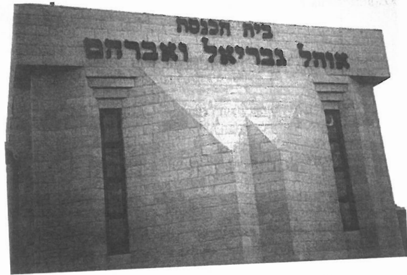
בית כנסת 'אוהל גבריאל ואברהם' בפסגת זאב מרכז

בעניין שמות בתי כנסת כחלק מתהליך זיכרון אין הבדל משמעותי בין שכונת פסגת זאב לשכונות אחרות. רק מחקר השוואתי רחב שיעשה עם מקומות אחרים יוכל להצביע על מייחדים נוספים.