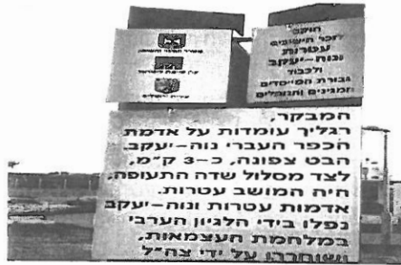
שלט הכניסה לגן הגבורה בפסגת זאב צפון

אנדרטאות הן סממן הזיכרון הבולט והמקובל ביותר בתודעת ההנצחה. הן אולי המי מחישות ביותר את הזיכרון ואת הפעילות למען הזיכרון. 28 עזריהו מגדיר את מטרת אנדרטאות הזיכרון: "מצבות זיכרון משלבות את ההיסטוריה במרחב וממזגות את המיתוס בנוף, עלייה לרגל לאנדרטה לטקס אזכרה ממצה את המסרים הסמליים שהקהילה מקנה ברגע נתון לעבר בתור זיכרון היסטורי". 29